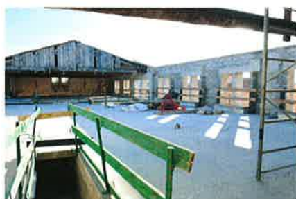
► Novembre 2009