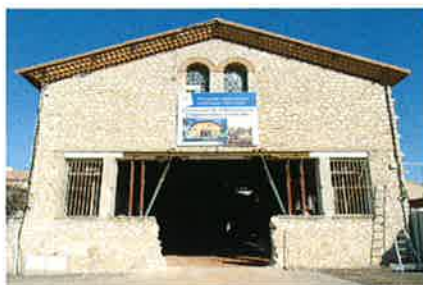
► Février 2008