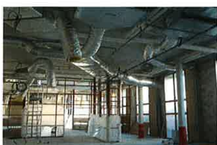
► Décembre 2010