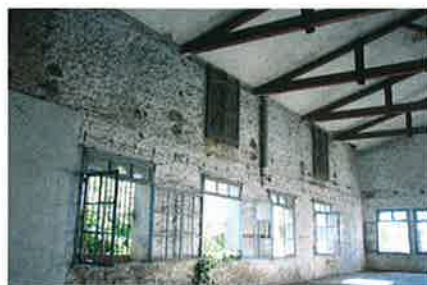
► Juillet 2007

Les travaux s'achèveront au cours du 3 e trimestre 2011. L'installation du mobilier et du système informatique, ainsi que la mise en place des collections de la médiathèque seront réalisés à la fin de l'année.