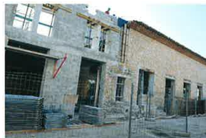
► Juillet 2009