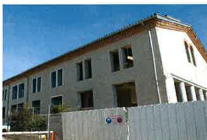
► Janvier 2011